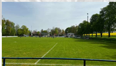
Sportplatz Nacker Straße, Erbes-Büdesheim