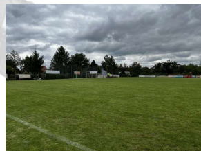
Sportplatz Ahrensberg, Nack