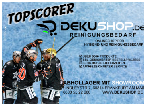
Beispiel Fanklatsche Löwen Frankfurt von dekushop.de